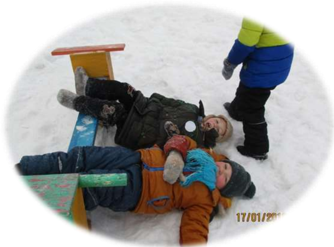
Колодец, колодец, Дай воды напиться...