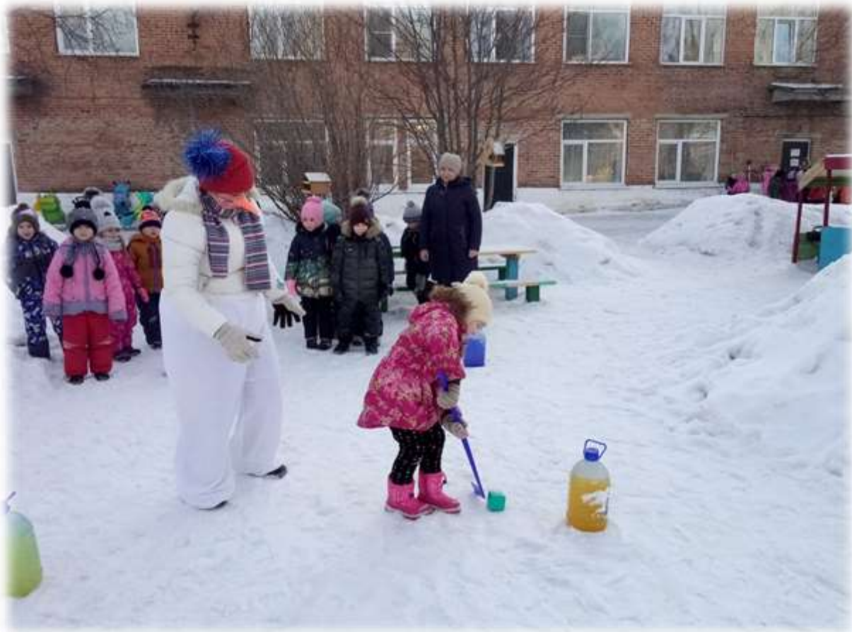
3 этап. Пройди по болоту, с кочки на кочку.